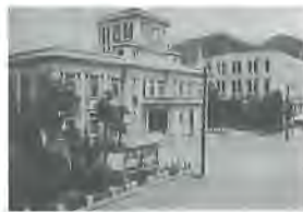
▲美江寺町にあった旧市役所

A. 現在の本庁舎は、昭和41年に建設(それまでの美江寺町から移転)され、47年が経過しています。また、南庁舎は昭和35年に建設された元岐阜中央郵便局を、昭和56年に購入し庁舎に転用したもので、53年が経過しています。