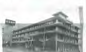
▲築53年経過の現南庁舎