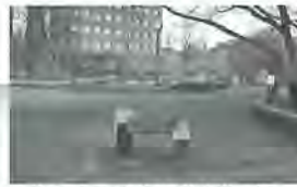
▲美江寺町市庁舎跡は公園に