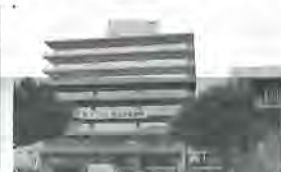
▲築47年経過した現市庁舎