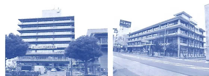
▲築47年経過した現市庁舎