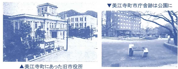
▲美江寺町にあった旧市役所

A. 現在の本庁舎は、昭和41年に建設（それまでの美江寺町から移転）され、47年が経過しています。また、南庁舎は昭和35年に建設された元岐阜中央郵便局を、昭和56年に購入し庁舎に転用したもので、53年が経過しています。