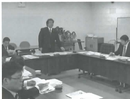
茨城県庁で委員長として挨拶