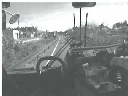
鹿島鉄道廃線跡地バス専用道化事業を視察

まず、茨城県庁を訪問、「鹿島鉄道廃線跡地バス専用道化事業」について説明を受け、実際に「かしてつバス」に体験乗車しました。定時制の確保された運行と、事業への行政の関わり方は、岐阜市の廃線跡地利用のひとつの例として参考になりました。