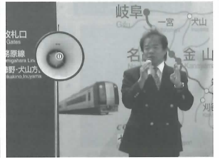
名鉄岐阜駅前市政報告の街頭演説