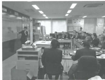
国土交通省・東北地方整備局の災害対策室