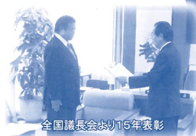
全国議長会より15年表彰