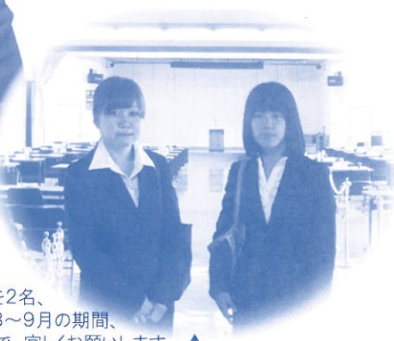
大学生のインターンを2名、受け入れています。8～9月の期間、一緒に行動しますので、宜しくお願いします。▲