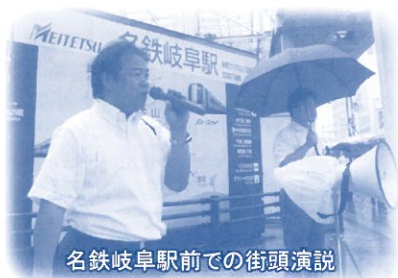
名鉄岐阜駅前での街頭演説