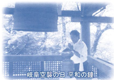
岐阜空襲の日 平和の鐘