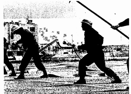
岐阜市中消防団特別点検にて。金華分団 の一番員としてホースを抱え全力疾走。