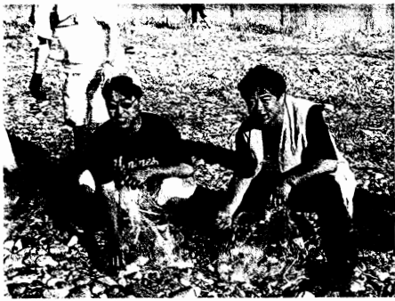
朝の空気を吸い、若い仲間と清掃奉仕。 長良川…金華山…岐阜市の宝を大切に。