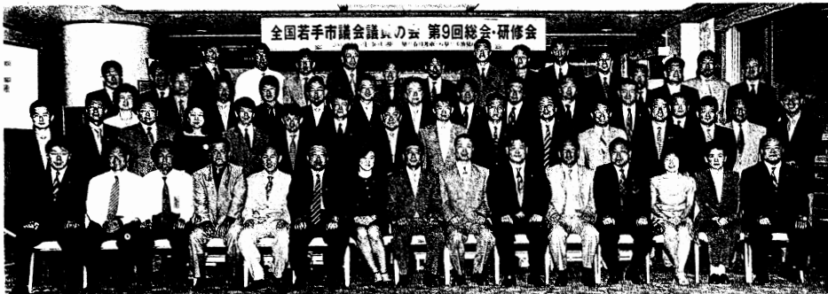
「全国若手市議会議員の会」総会にて。移動後、田中康夫氏 (長野県知事)を招き記念講演とパネルディスカッションを開催。